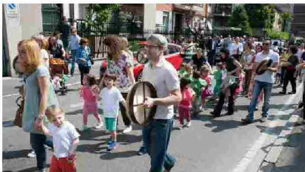
Scuole in festa in zona 9