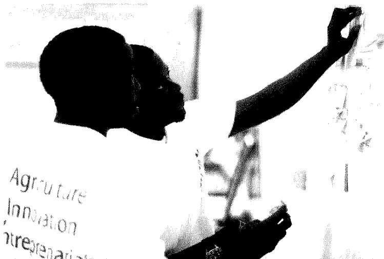
YeesealAgriHub, incubatore di start up a Dakar, Senegal

Anche per questo, l'Africa attrae, sempre di più, molte giovani donne altamente qualificate e non ne-